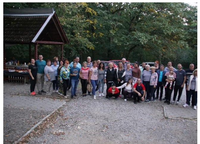
Galerie foto – regal studențesc 12-14.10.2023