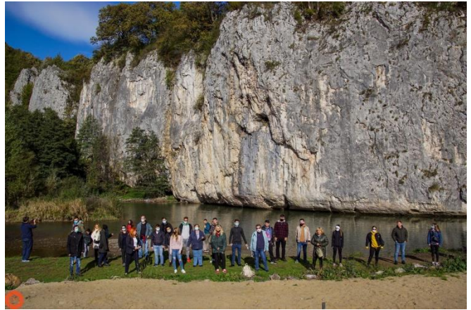
Galerie foto – regal studentesc 15-17.10.2020