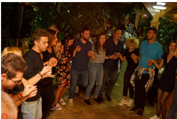
Galerie foto – BACStud 2019 și evenimente asociate