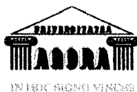
Figura 1. Emblema Universității Agora